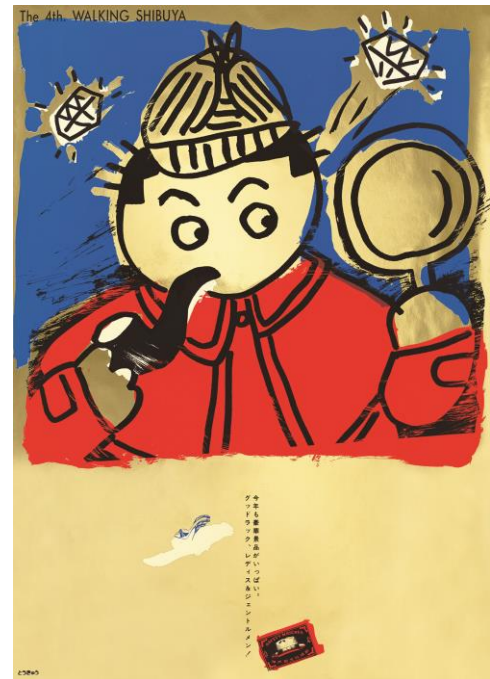
画像② 「The 4th. WALKING SHIBUYA」 東急電鉄、制作年不明

イラストレーターとして、書籍の装丁・装画や広告ポスターなどを手がける一方、漫画や絵本の制作、小説・エッセイの執筆など、多彩な創作活動を展開した安西水丸(1942～2014)。現在、世田谷文学館で開催中の「イラストレーター 安西水丸展」と連動して、 1970年代から2010年代にかけて制作したポスター約25点を展示紹介 します。