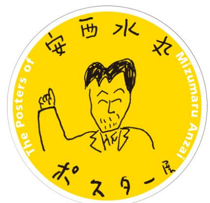
画像④ 「パル」発行元・制作年不明