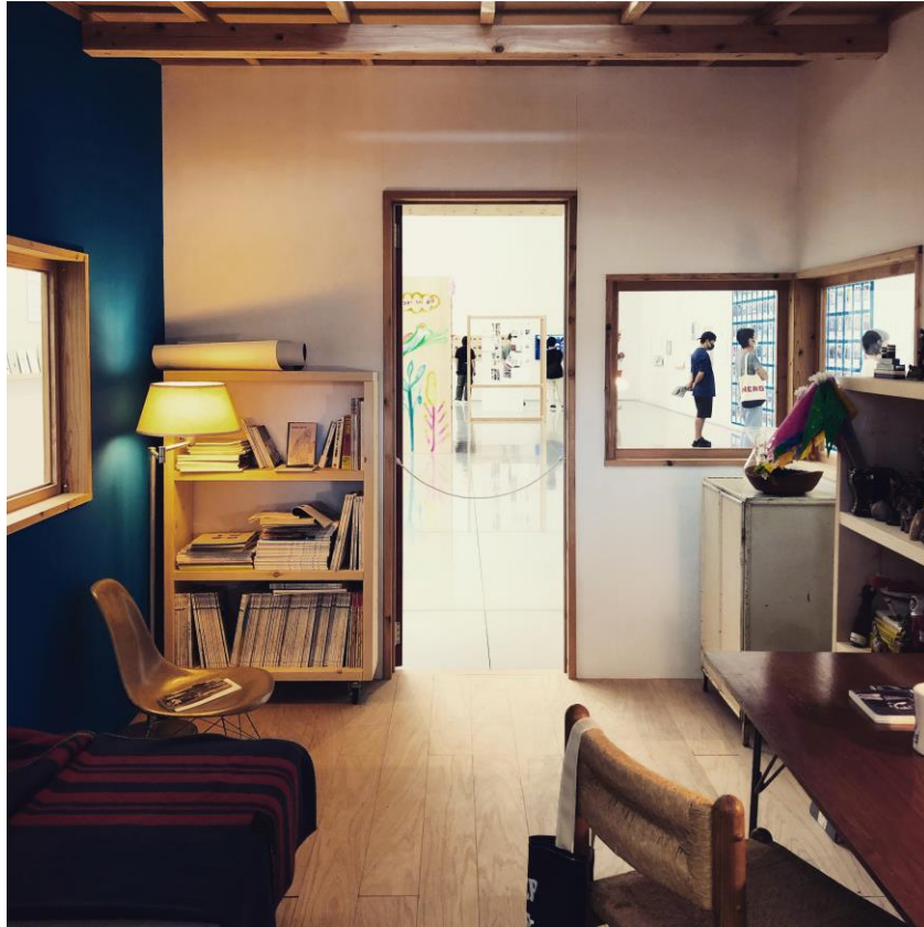
画像①「岡本仁が考える 楽しい編集ってなんだ？」展示風景 (2021年、鹿児島県霧島アートの森)