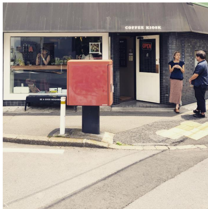
画像④ コンセプトメイキングを行った コーヒースタンド 「BE A GOOD NEIGHBOR」 (渋谷区千駄ヶ谷)

主催 公益財団法人せたがや文化財団 生活工房 協力 世田谷美術館 後援 世田谷区、世田谷区教育委員会