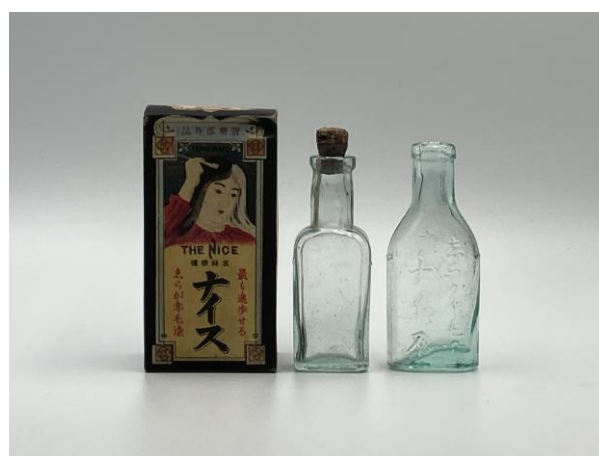
画像⑤ 志らが赤毛染ナイス

日本国内で最初に発売されたとされる酸化染毛剤。洗った髪に液体を塗り 12 時間放置し、洗い流して乾かす。 (服部松栄堂／明治 40 年頃発売)