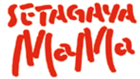
画像② セタガヤママのロゴ (デザイン：平野甲賀)

会場では、当時のミニコミや写真、平野甲賀のグラフィックといった貴重な作品から、現在も続く「あめつうしん」まで、およそ40年分の資料を展示します。さらに「セタガヤママ」周辺の子どもたちが当時を振り返ったエッセイ、常連だった絵本作家・石津ちひろが書き下ろした詩もご紹介。それぞれの視点から、生活を軸にした小さなメディアの活動を辿ります。マンションの一室から出発したママたちの冒険と、その「続き」をお楽しみください。