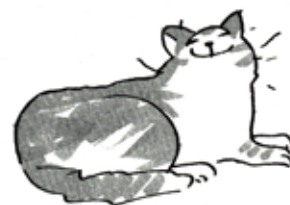
イラスト：木村さくら