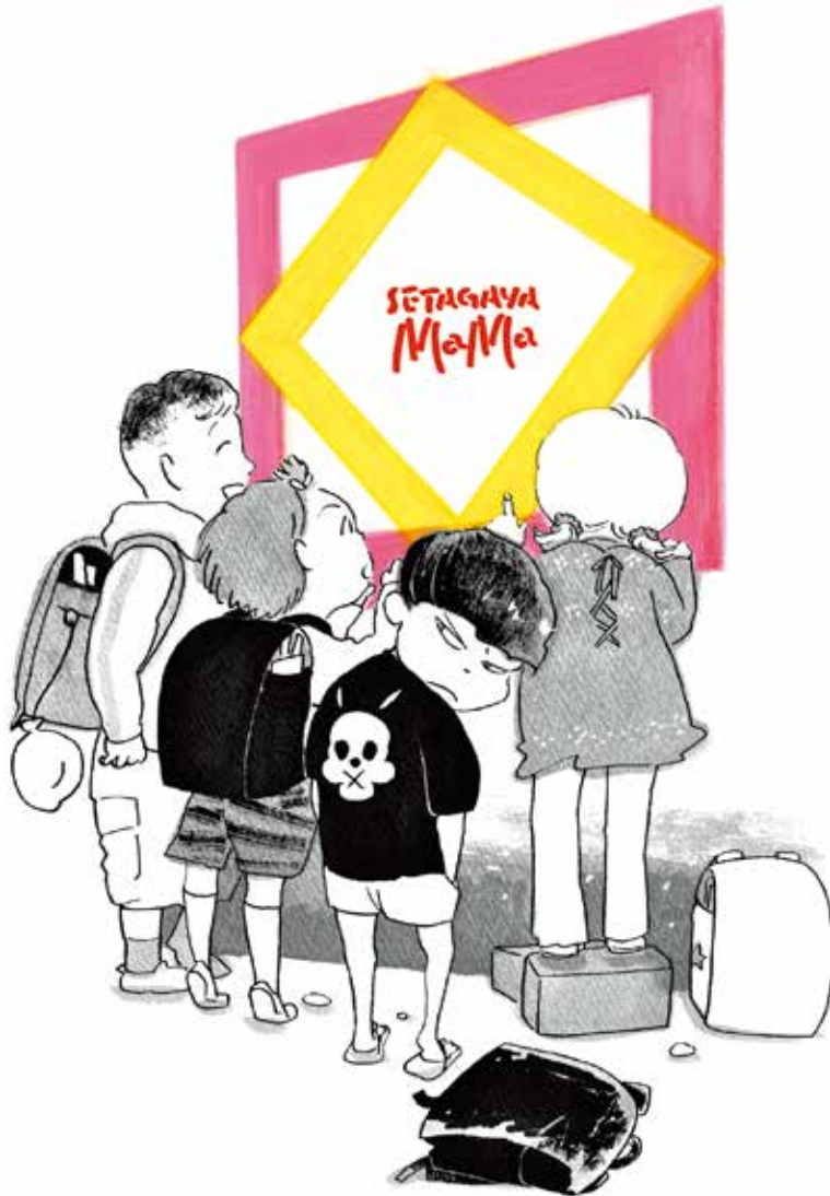
画像① メインビジュアル (イラスト: 木村さくら)