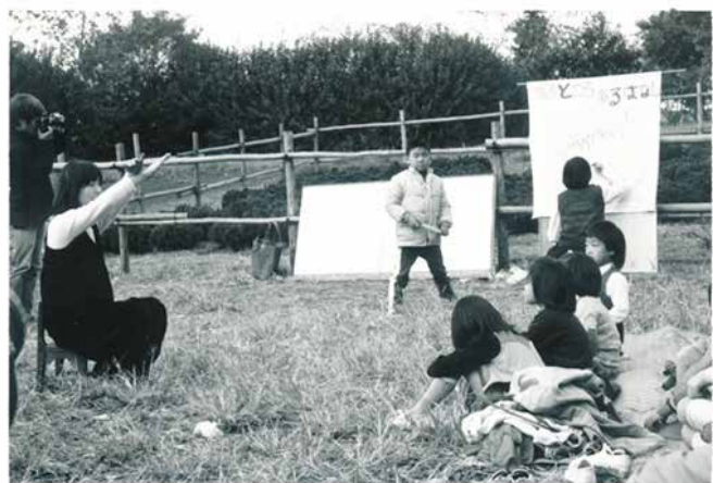
画像⑬ 「あめの会」での活動風景