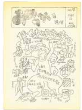
画像③ 「あめの会通信」表紙 (謄写印刷、1981年、No.12)