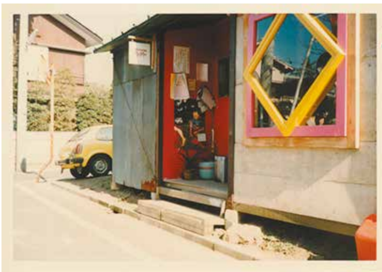
画像④ セタガヤママ外観