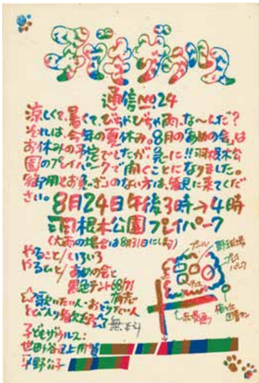
画像⑫ 平野甲賀のプリントゴッコ